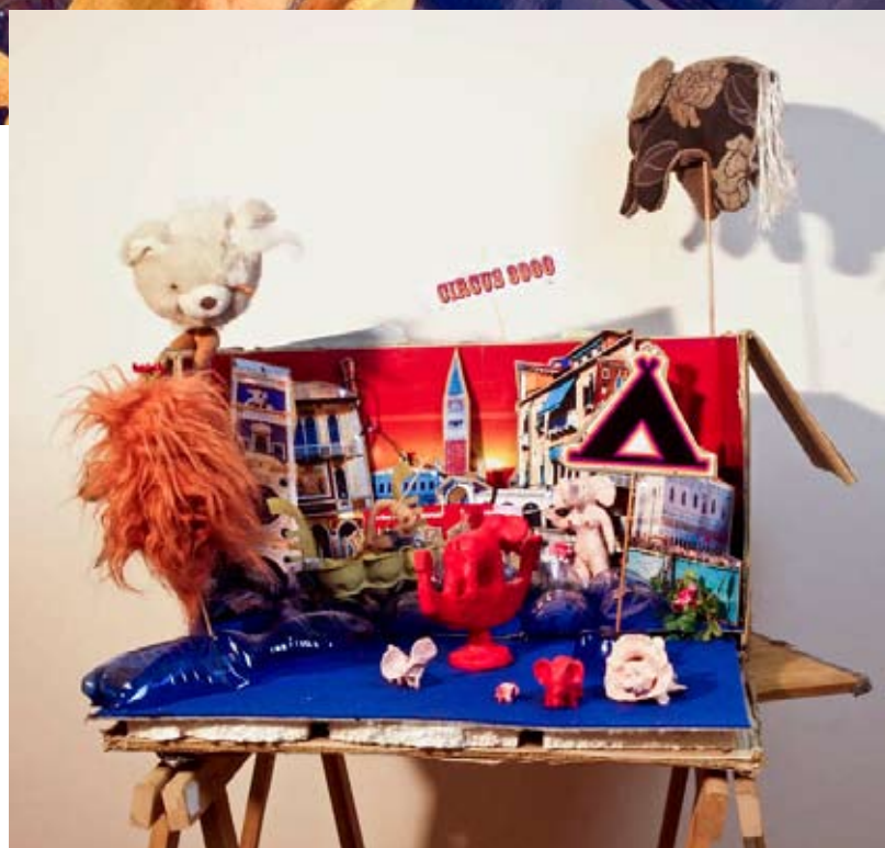
CIRCUS3000 – „Westpaket“ Collective Art-Work, Collage, Assamblage