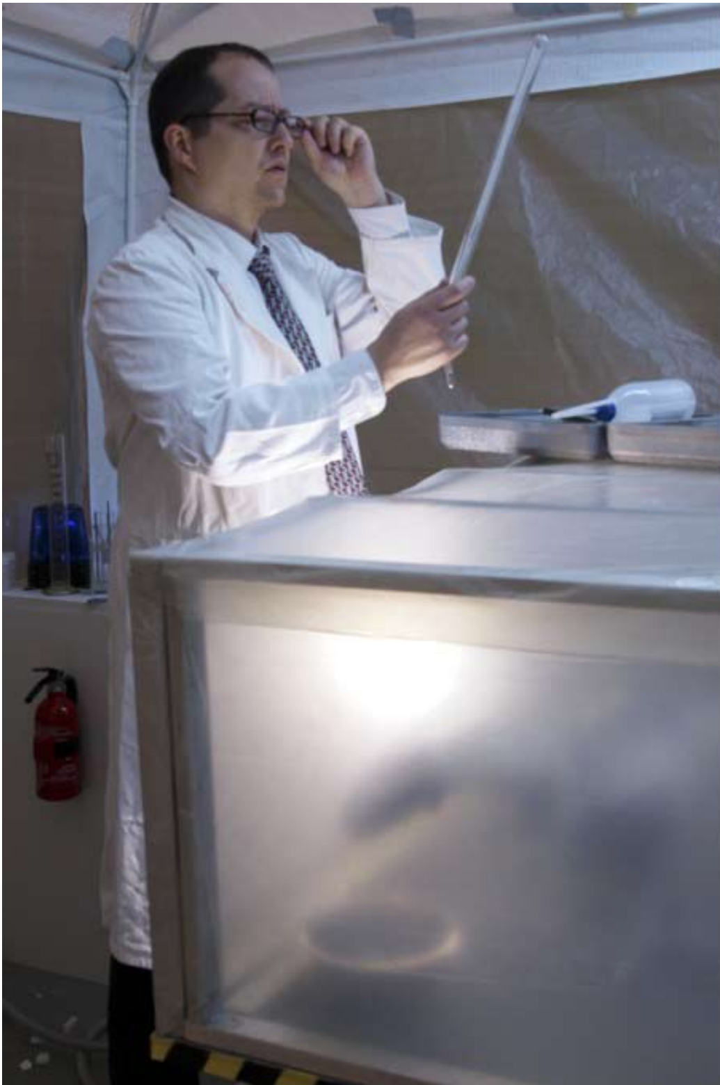
The Human Pet Project – Kleine Zwischenfälle im Genlabor (Installation, Fotos von Marcel Vangermain, 2011)