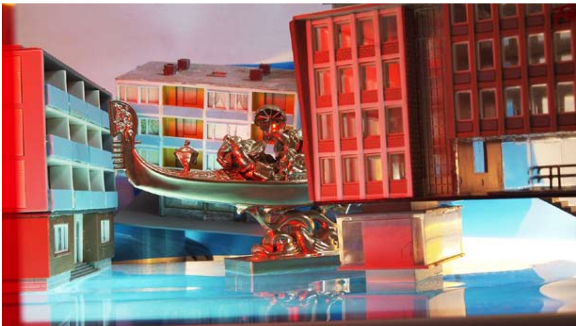
Elephants in Venice No.3, Marcel Vangermain, Fotoarbeit