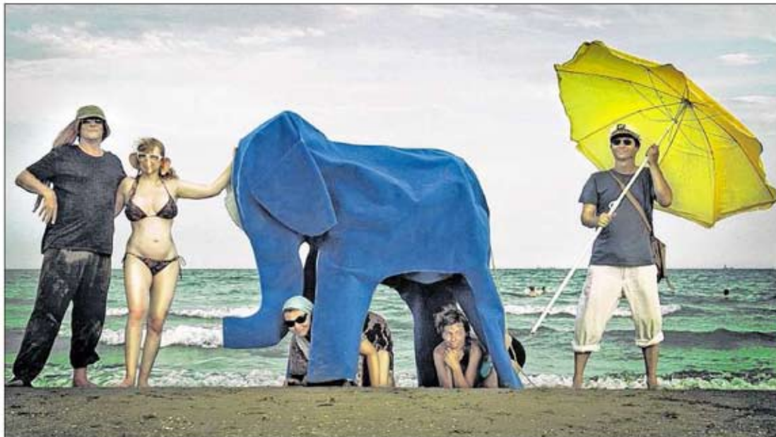
BLAUER ELEFANT AM SANDIGEN STRAND: Wer – wie die Karlsruher Künstlergruppe Circus 3000 seine Ausstellung „Ante portas“ nennt, der kommt um eine Anspielung auf Hannibal, der mit Kampfelefanten über die Alpen zog, nicht herum.

Hannibalisch geht es im „WinterQuartier“ derzeit zu, könnte man sagen. Denn in dem Projektraum im Hinterhof des Grundstückes Winterstraße 44b, zeigt die Künstlergruppe Circus 3000 derzeit ihre Ausstellung „Ante portas“.