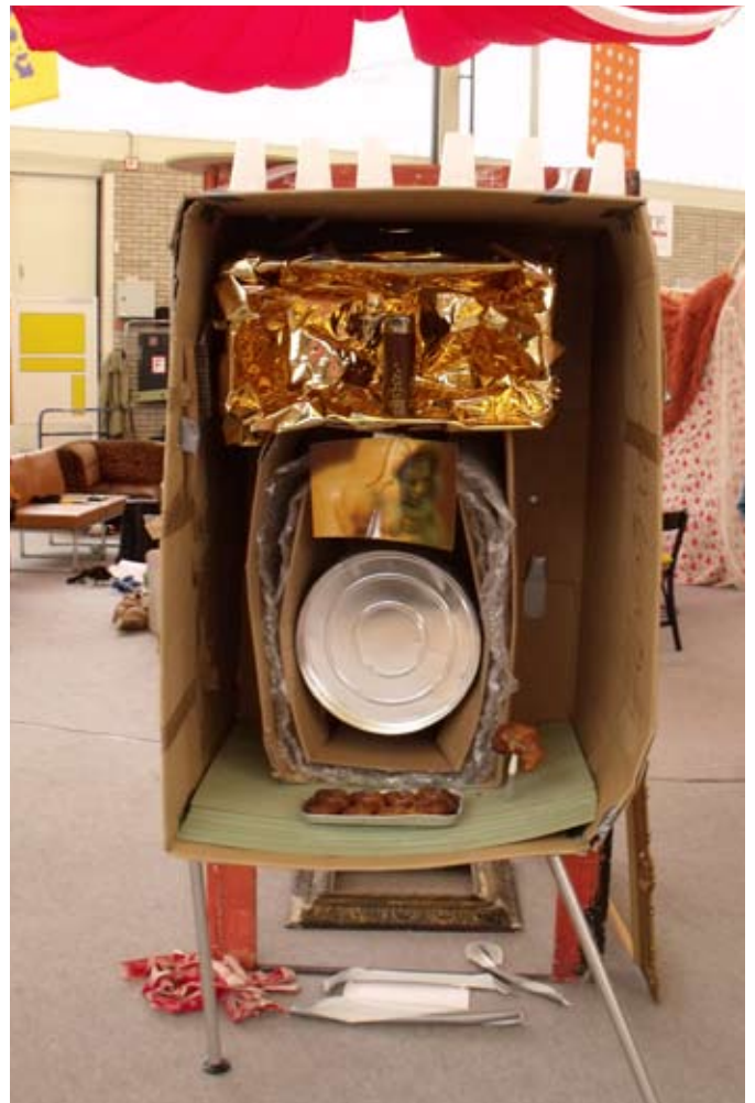
Herbie Erb, Spaceship