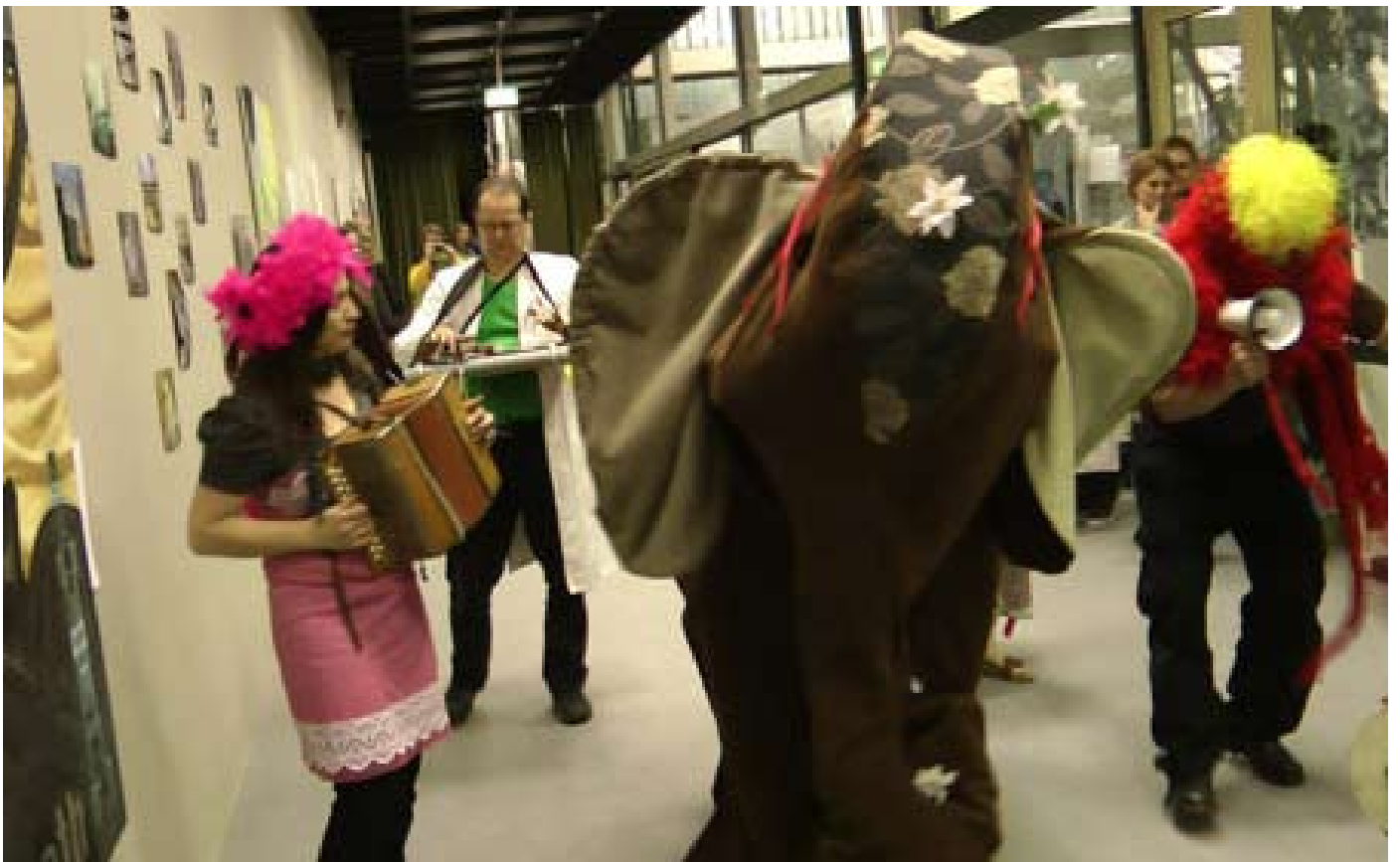
Freakshow Elephant Walk, Performance