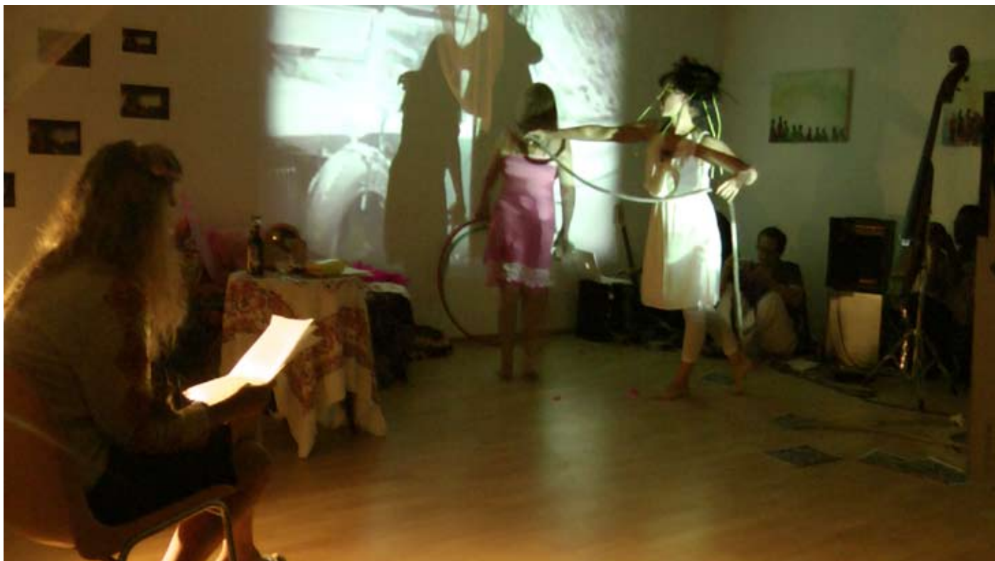
CIRCUS3000 multimedial Performanceshow with Music and Videos Scenic Reading at "Winterquartier" Karlsruhe , Juli 2011